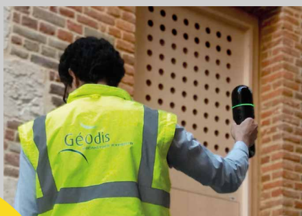
Un encombrement minimal

Ces caractéristiques font du BLK2GO l'outil privilégié de Géodis pour effectuer des relevés avec des délais courts, une disponibilité restreinte des locaux accueillant du public, dans des espaces confinés ou en co-activité.